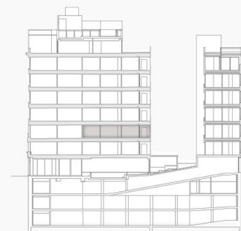
Pº G. M Campos