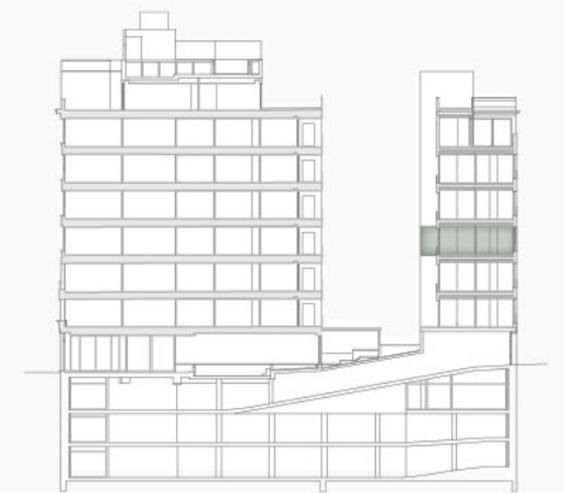
Pº G. M Campos