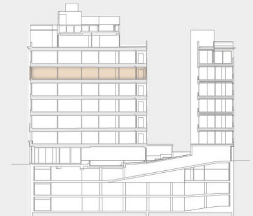
Pº G. M Campos