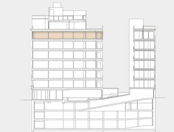
Pº G. M Campos